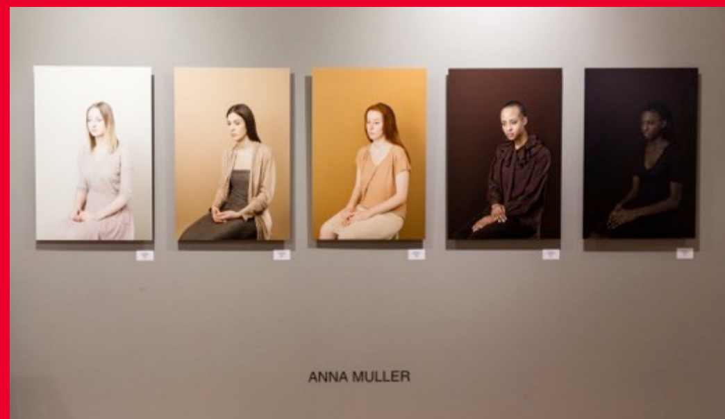
Stand de Galerie STP

Note : L'allocation des stands se fait au fur et à mesure. Nous vous conseillons vivement de soumettre votre projet le plus tôt possible pour bénéficier d'un plus large choix de stands et pour anticiper la communication.