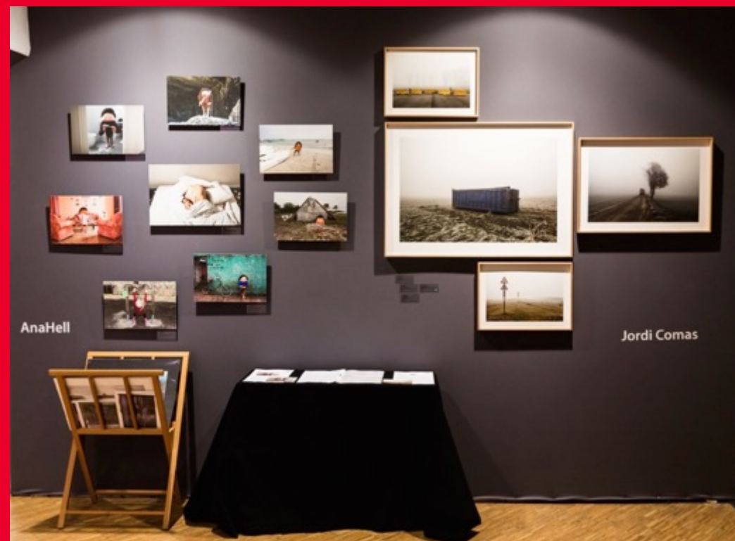
Stand de la galerie Projekteria