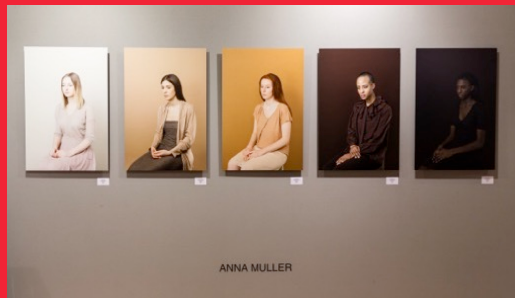
Stand de Galerie STP

Note : L'allocation des stands se fait au fur et à mesure. Nous vous conseillons vivement de soumettre votre projet le plus tôt possible pour bénéficier d'un plus large choix de stands et pour anticiper la communication.