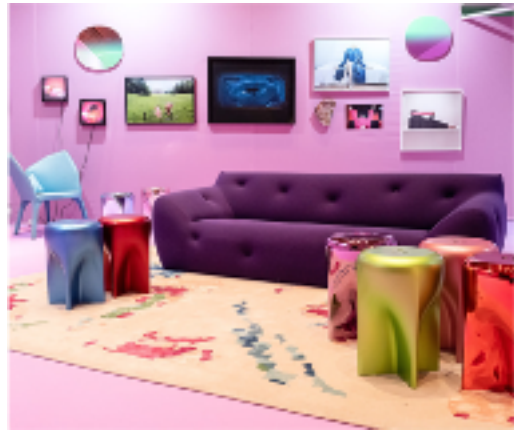
L'appartement du collectionneur 2019

Une nouvelle scénographie et un nouvel emplacement pour le désormais célèbre appartement du collectionneur de fotofever, qui accueille les œuvres des exposants autour de 5 thématiques inédites, en partenariat avec Roche Bobois.